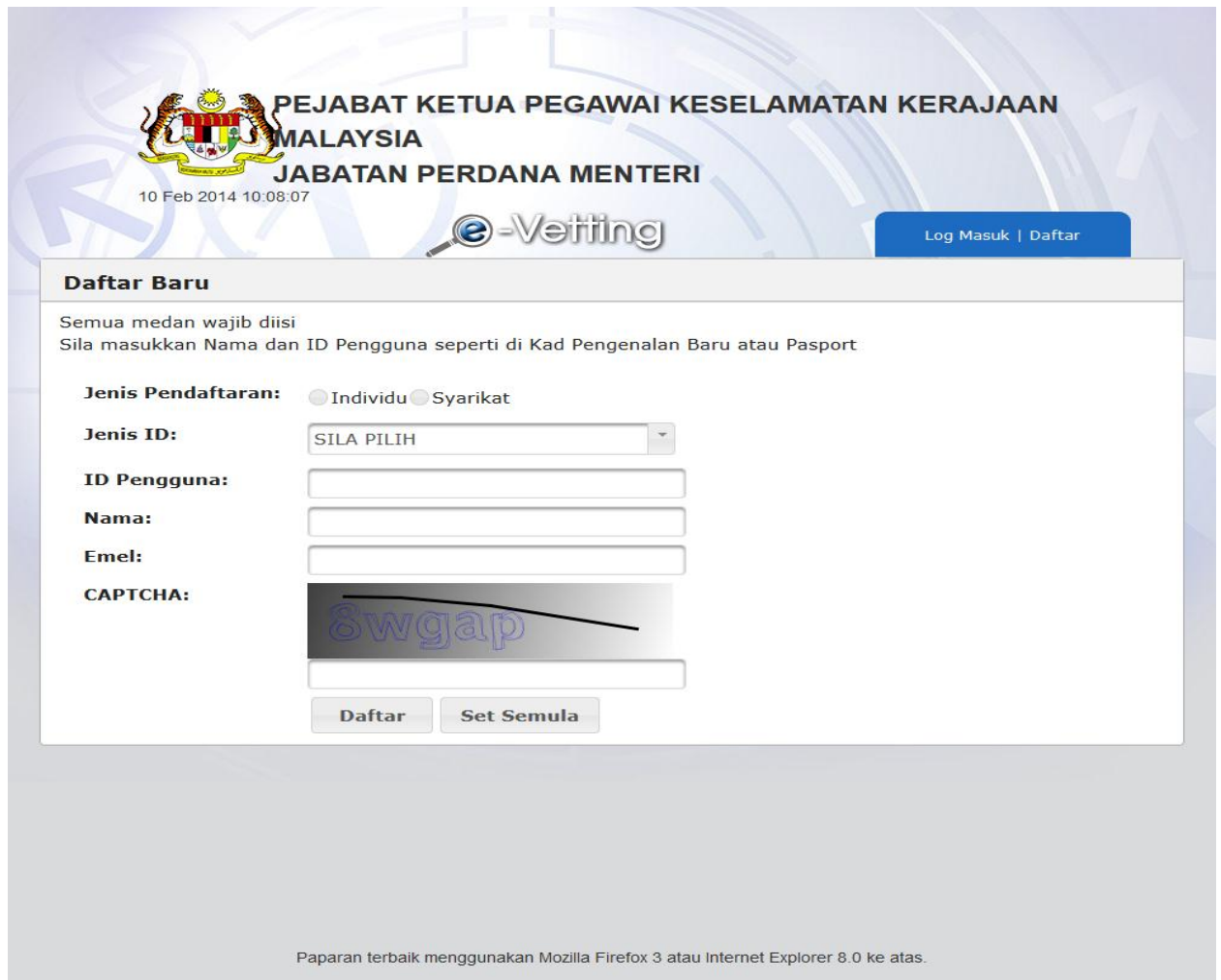
Gambarajah 2: Daftar Baru

Langkah 03: Sila pilih Jenis Pendaftaran .